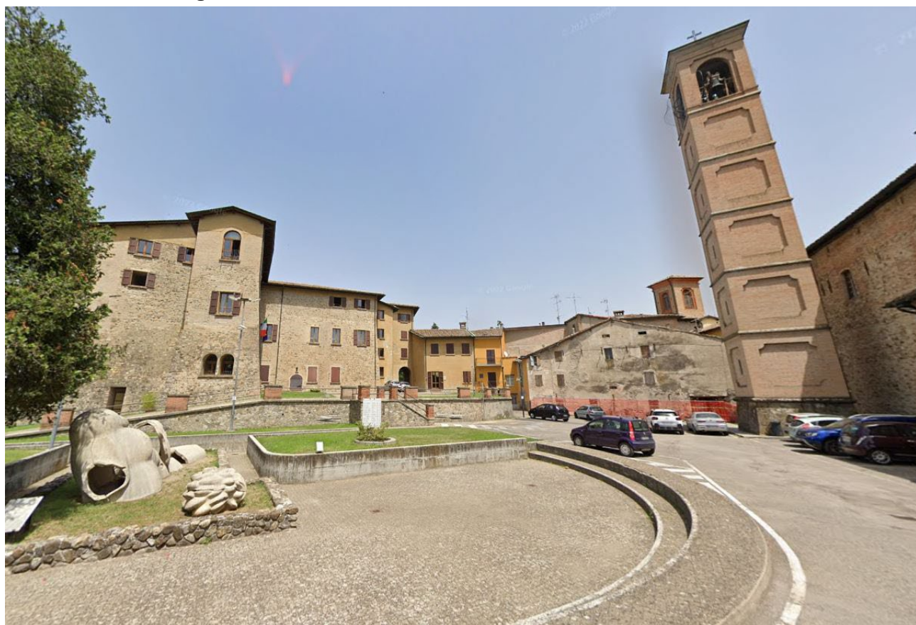
Vista su Via Sartori