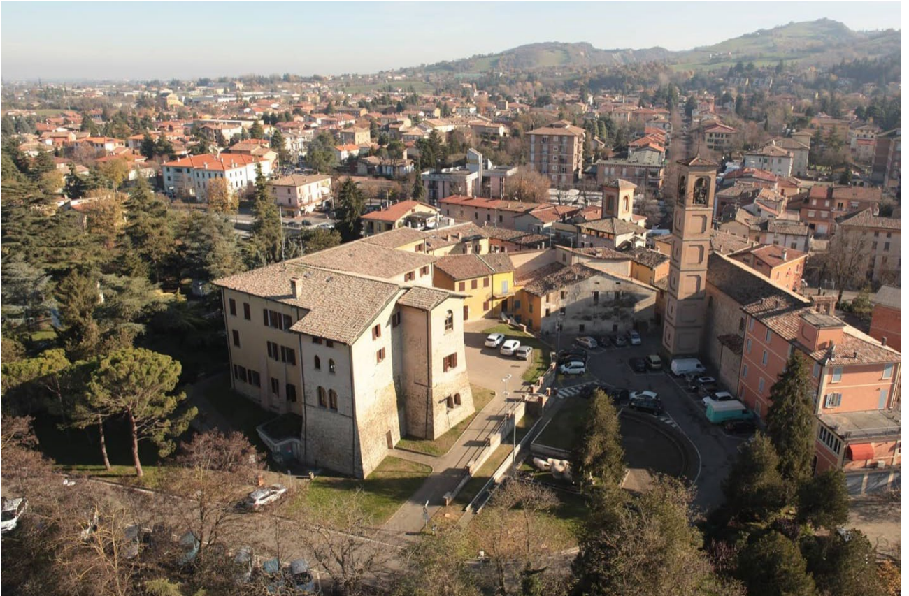
Vista Aerea su Via Sartori