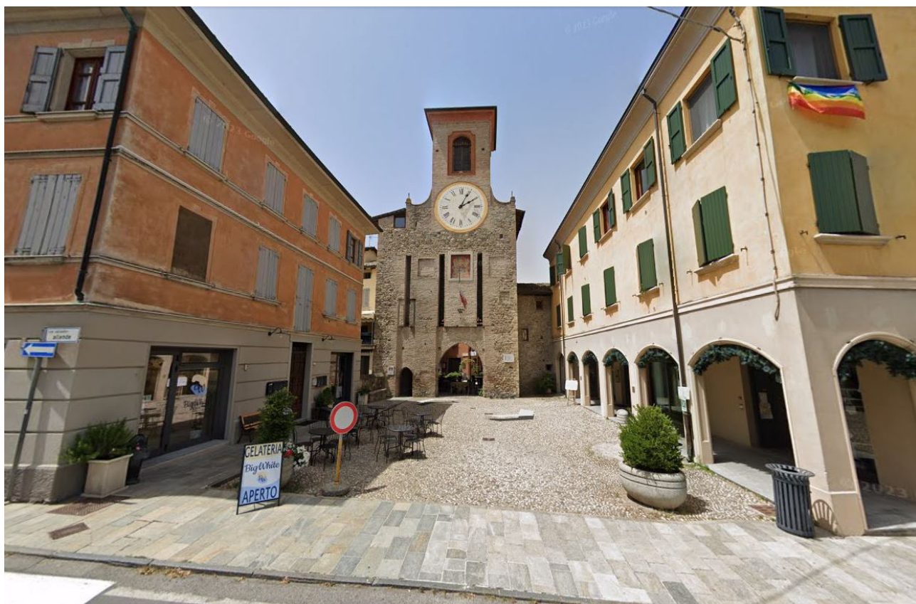
Vista Torre dell'Orologio