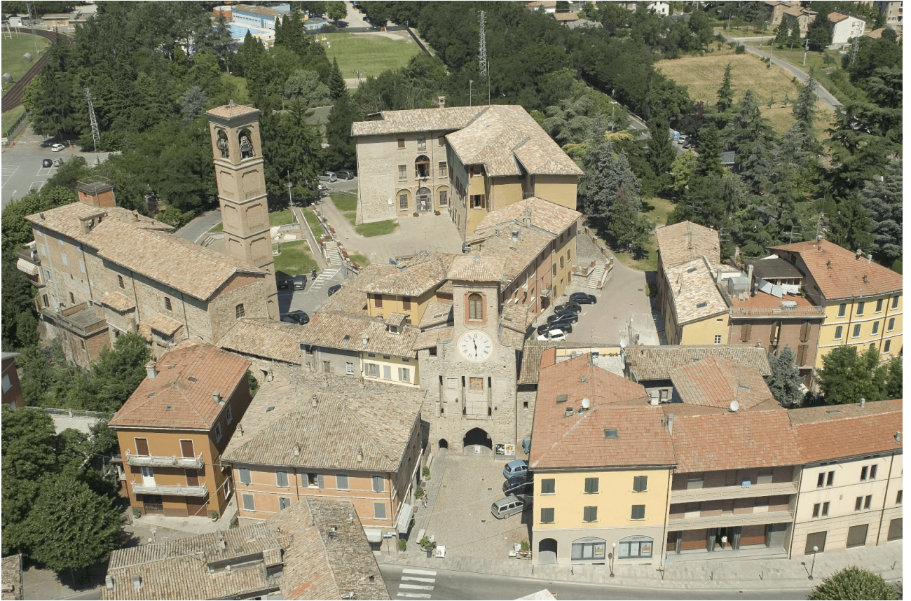
Vista Aerea Torre dell'Orologio