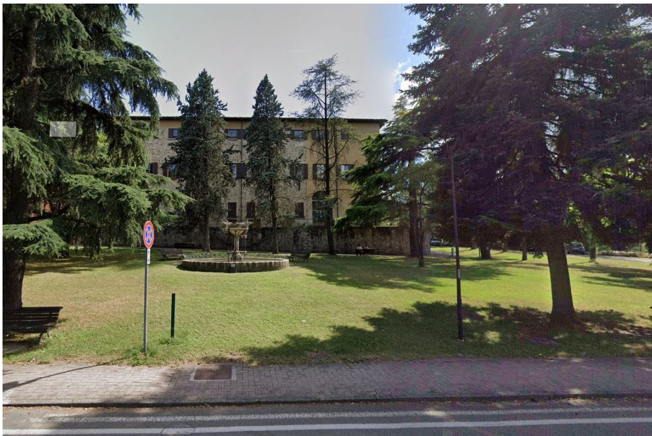
Vista del parco da Via XXIV Maggio